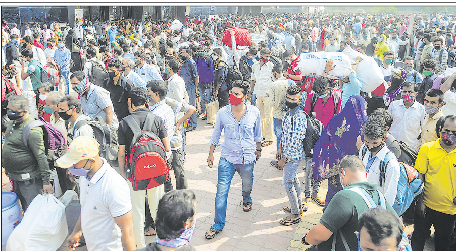
मुम्बई में लॉकडाउन लगने से पहले प्रवासी मजदूरों की रेलवे स्टेशन पर उमड़ी भीड़।

न करने से कोरोना वायरस तो खुश हो रहा होगा जबकि देशवासियों के लिए यह बहुत ही चिंताजनक हालात पैदा हो रहे हैं। देश में कोरोना