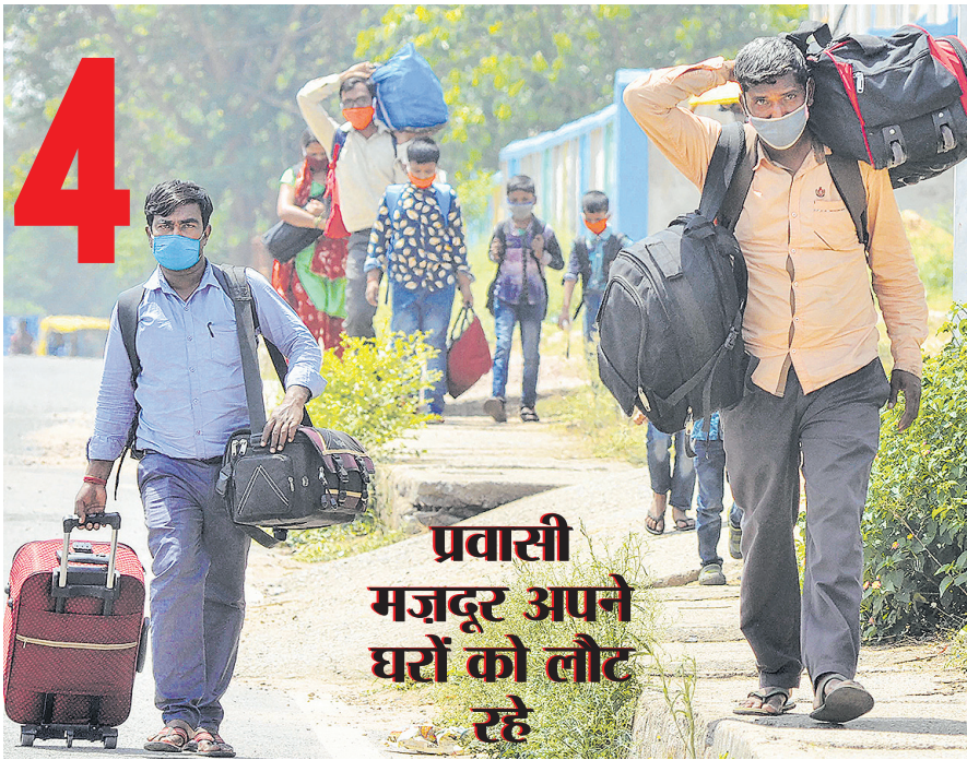
प्रवासी मजदूर अपने घरों को लौट रहे रांची में रेलगाड़ियां न मिलने के कारण प्रवासी अपने परिवार सहित घरों को पैदल ही लौटते हुए।

देश में कोरोना से 1,027 और लोगों ने तोड़ा दम