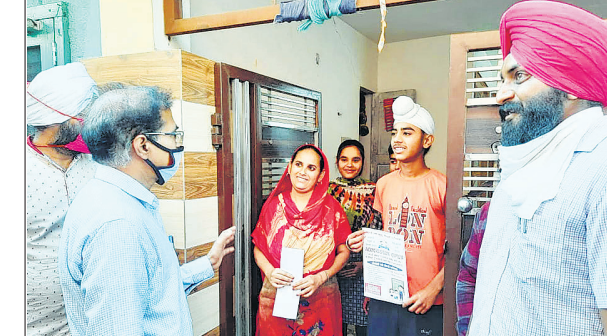
शिक्षा सचिव द्वारा घर-घर जाकर दाखिला मुहिम को समर्थन देने का दृश्य।

पोजेवाल सरां, 12 अप्रैल (नवागढ़ी): शिक्षा विभाग द्वारा चलाई जा रही शिक्षा सुधार मुहिम का असर नये शैक्षणिक वर्ष के दौरान आरम्भ की गई दाखिला मुहिम में प्रत्यक्ष रूप में ज़मीनी स्तर पर पहले सप्ताह में ही देखने को मिल रहा है। पहले सप्ताह में ही 33132 बच्चे निजी स्कूलों से हट कर राज्य के विभिन्न जिलों के सरकारी स्कूलों में दाखिल हुए हैं। शिक्षा विभाग के सूत्रों से मिली जानकारी के अनुसार