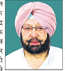
कैप्टन अमरेंद्र सिंह

चंडीगढ़, 12 अप्रैल (अ.स.): पंजाब के मुख्यमंत्री कैप्टन अमरेंद्र सिंह ने 'खांसा पंथ' के स्थापना दिवस व बैसाखी पर्व की विश्वव्यापी बधाई दी है। कैप्टन ने पंजाब के अमीर सांस्कृतिक विरासत की याद दिलाते हुए इन