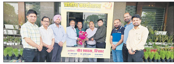
रतिया : जानकारी देते हुए शाखा के सदस्य।