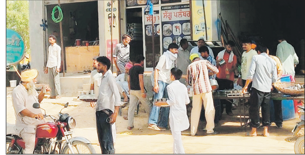
छबील पर नींबू पानी पिलाते सेवादार।