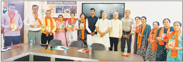
नरवाना : युमिंग प्रोग्राम के दौरान डीएवी शताब्दी पब्लिक स्कूल के स्टाफ सदस्य व अन्य ।