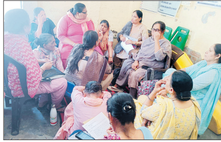
रतिया : बैठक करते हुए आंगनबाड़ी वर्कर यूनियन की सदस्य।

रतिया, 25 मई (राजेंद्र मित्तल) : प्रदेश सरकार की ओर से भीषण गर्मी को देखते हुए 25 मई से 30 जून तक सभी सरकारी और निजी स्कूलों में ग्रीष्मकालीन अवकाश घोषित कर दिए गए हैं, लेकिन आंगनबाड़ी केंद्रों और आंगनबाड़ी कम प्ले स्कूलों के लिए अब तक कोई आदेश जारी नहीं होने से छोटे बच्चों और आंगनबाड़ी कर्मचारियों की परेशानी बढ़ गई है। आंगनबाड़ी केंद्रों में आने वाले बच्चों की उम्र स्कूलों में पढ़ने वाले विद्यार्थियों से काफी कम होती है, लेकिन इसके बावजूद उन्हें तेज गर्मी में केंद्रों तक पहुंचाना पड़ रहा है। हालात यह है कि जिले के अधिकतर आंगनबाड़ी केंद्रों में गर्मी से बचाव के लिए पर्याप्त सुविधाएं तक उपलब्ध नहीं हैं। कहीं स्वच्छ व ठंडे पेयजल की व्यवस्था नहीं है तो कहीं केंद्रों में बिजली की सुविधा न होने से पंखे तक नहीं चल पा रहे। ऐसे में तपती दोपहर के दौरान नौनिहाल गर्मी से बेहाल नजर आ रहे हैं।