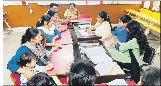
रतिया : अध्यापक-अभिभावक बैठक का दृश्य।