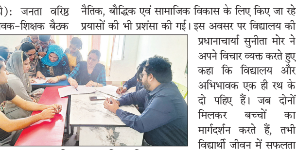
नरवाना : जनता वरिष्ठ माध्यमिक विद्यालय बेलरखा में बैठक के दौरान अभिभावक-शिक्षक।

नरवाना, 25 मई (विकास जेठी) : जनता वरिष्ठ नैतिक, बौद्धिक एवं सामाजिक विकास के लिए किए जा रहे माध्यमिक विद्यालय बेलरखा में अभिभावक-शिक्षक बैठक आयोजित किया गया। बैठक में विद्यार्थियों के अभिभावकों ने उस्साहपूर्वक भाग लिया तथा अपने बच्चों की शैक्षणिक प्रगति, अनुशासन, व्यवहार एवं विद्यालयीय गतिविधियों के बारे में शिक्षकों से विस्तारपूर्वक चर्चा की।